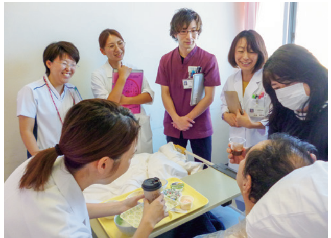
栄養サポート回診の様子