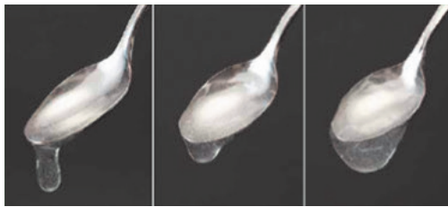
①薄いとろみ ②中間のとろみ ③濃いとろみ