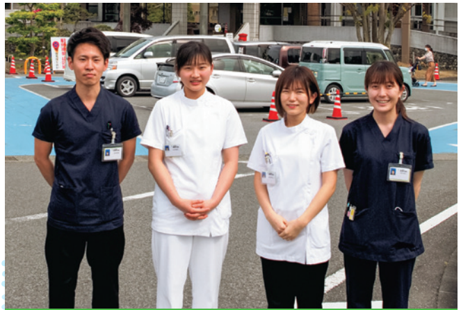
コメディカル部門