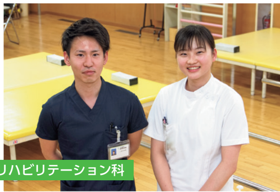
リハビリテーション科