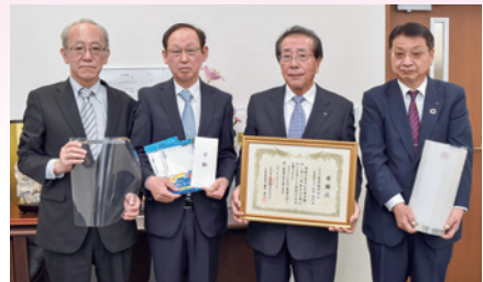
いび川農業協同組合様より、医療用ガウンの代替品となるレインコートとフェイスシールド用のフィルムを寄贈していただきました。